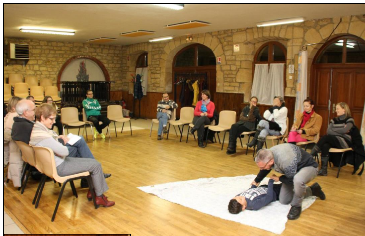
Les Loulous en fête de Saint-Jean-lès-Longuyon ont organisé une séance de formation. Photo RL

Alerter, masser, défibriller, trois notions qui, en cas d'arrêt cardiaque chez une personne, sont d'une importance cruciale à mettre en œuvre. On sait que la rapidité de l'intervention optimise les chances de survie : une minute gagnée, c'est 10 % de chances de survie en plus. Il est donc primordial de savoir quoi faire, dans quel ordre et avec les bons réflexes.